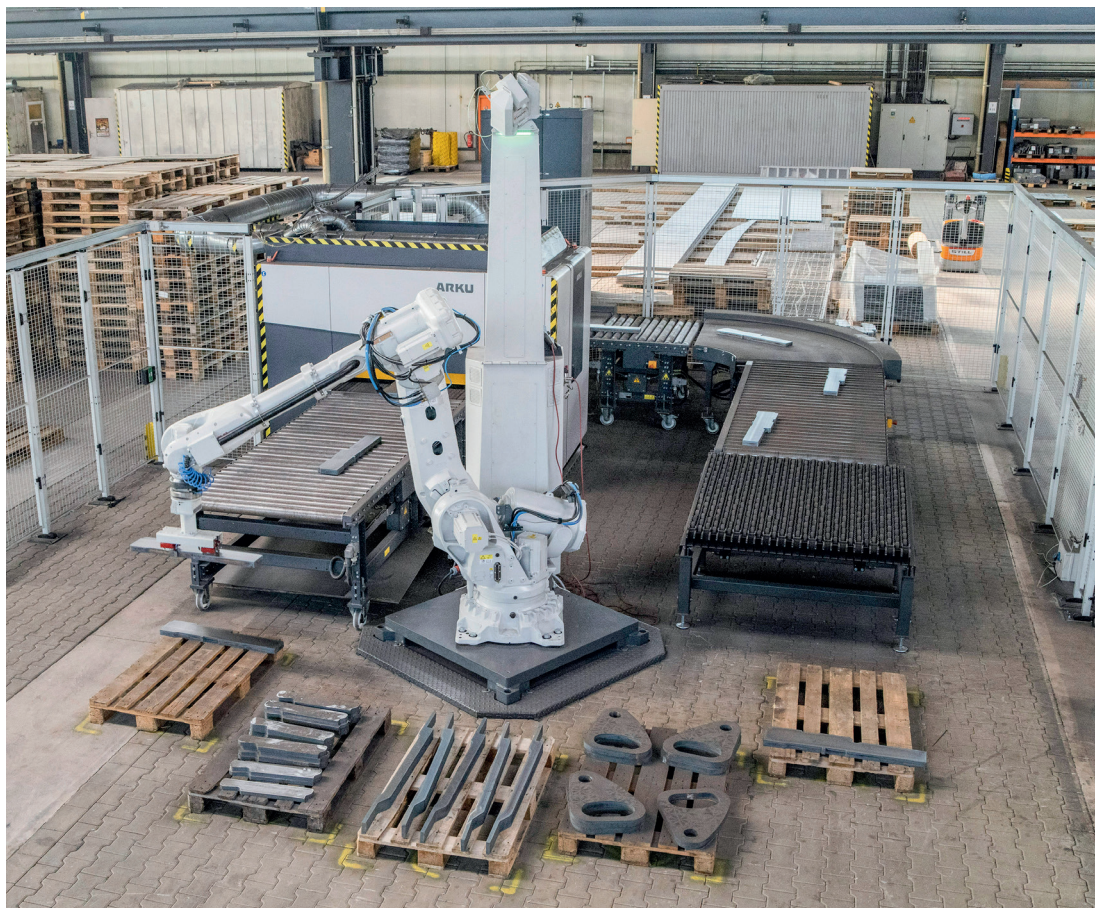
Der EasyBot ist ein hochmoderner Handlingroboter, der das Be- und Entladen des EdgeBreaker 4000 im Alleingang meistert und autonomes Entgraten ermöglicht.

Richten erfolgte bis dahin manuell auf einer älteren Anlage, doch die Ebenheiten boten noch Luft nach oben. Auch entgratet wurde noch händisch mit Winkel- und Bandschleifern. „Wir mussten auch in diesem Bereich automatisieren, um den Kunden zufrieden zu stellen“, erinnert sich Götze.