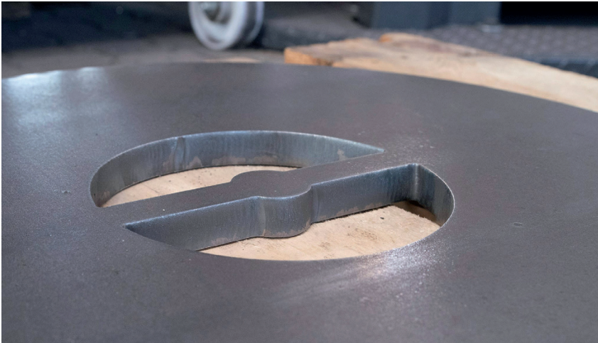
Eine runde Sache: Gerade dicke Bleche entgratet und verrundet der EdgeBreaker 4000 dank der speziellen Entgratwalze zu- verlässig – und zwar beidseitig in einem Arbeitsgang.

Diese lassen sich schneller und prozesssicherer umsetzen.